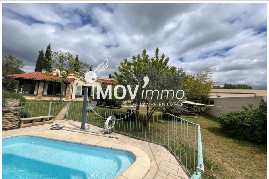
Villa AG1316 Uzès

PROCHE ST QUENTIN LA POTERIE : Villa pp de 1980 totalement rénovée de 135 m 2 + véranda plein sud de 15 m 2 , comprenant belle pièce de vie de 60 m 2 et cuisine équipée, 3 chambres (16/12/25 m 2 ) dont 1 suite parentale avec sdbains et wc, sde, wc séparé. Jardin arboré sans vis à vis de 3200 m 2 env. piscine 9x4m et dépendances. Forage, arrosage auto. Clim. Panneaux solaires. DANS UN BEL ENVIRONNEMENT